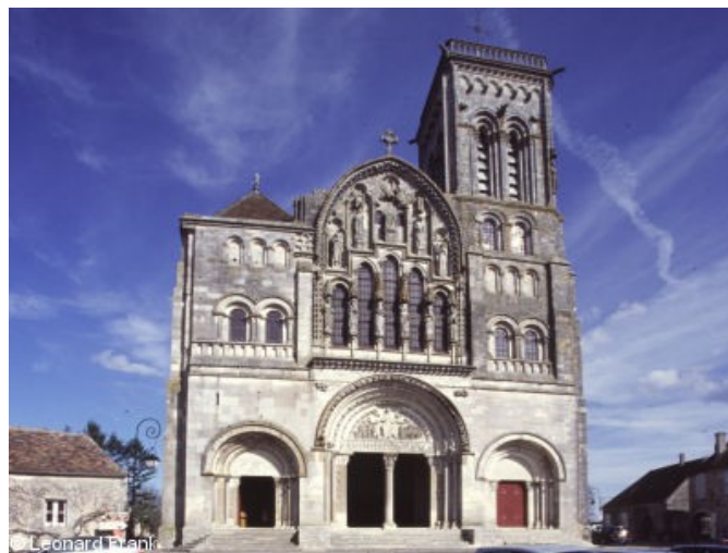
Fronton du XIIIe siècle: la Porte des pieds

Aussi, par ailleurs, ne faut-il pas s'étonner de trouver des preuves de la Connaissance de ce symbolisme initiatique des portes et des tourbillons chez les imagiers sculpteurs de nos basiliques romanes. Car à quelques millénaires d'intervalle, l'intention des maîtres d'oeuvre demeure semblable.